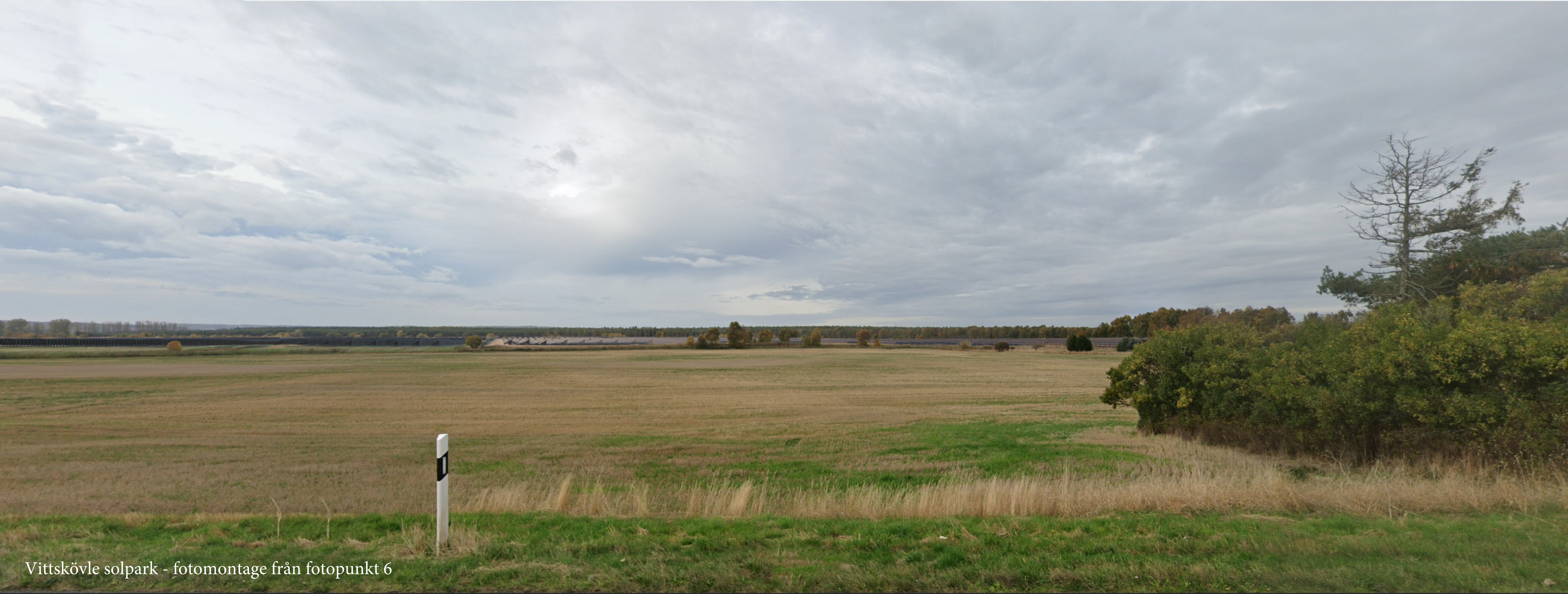
Vittskövle solpark - fotomontage från fotopunkt 6