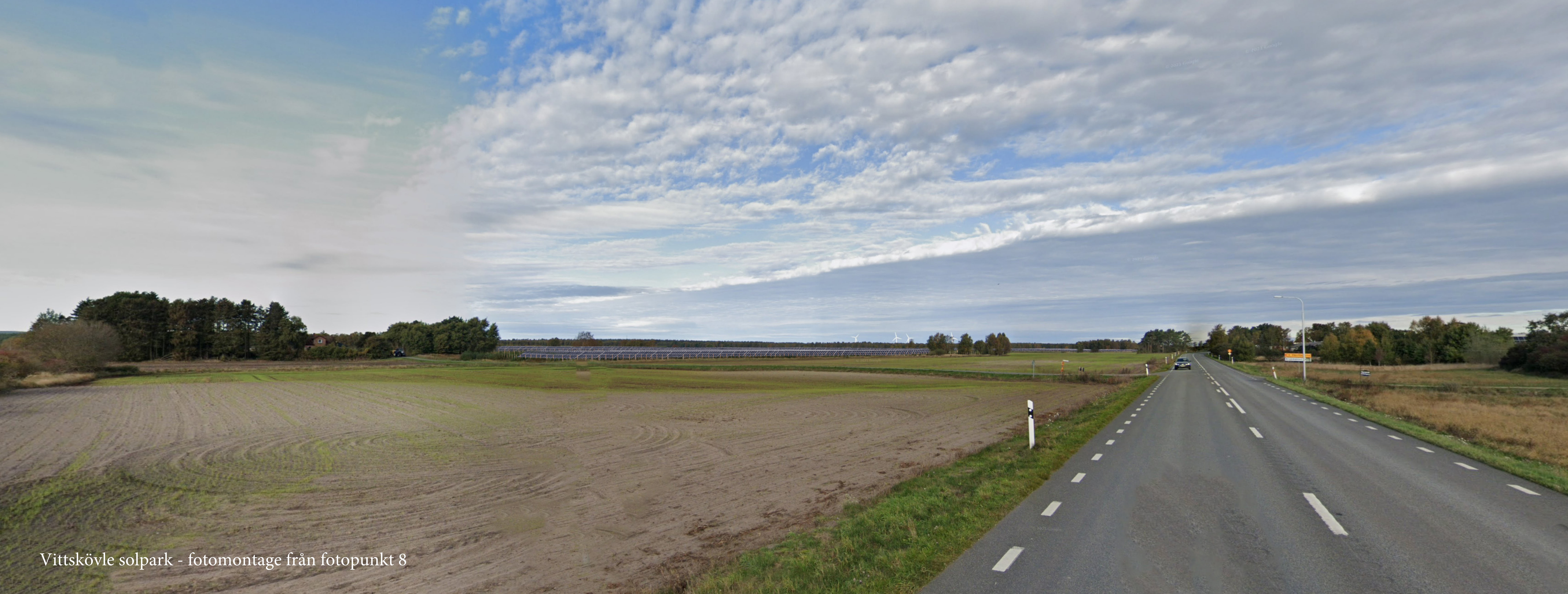
Vittskövle solpark - fotomontage från fotopunkt 8