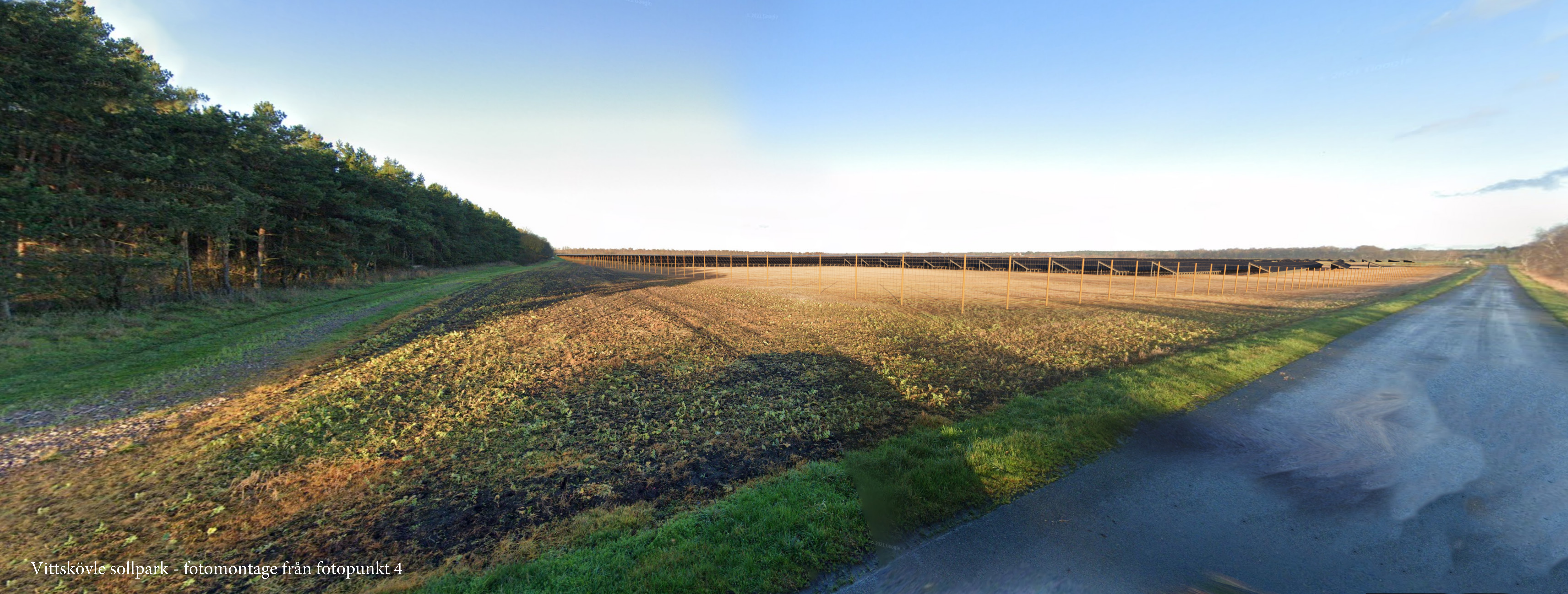
Vittskövle sollpark - fotomontage från fotopunkt 4