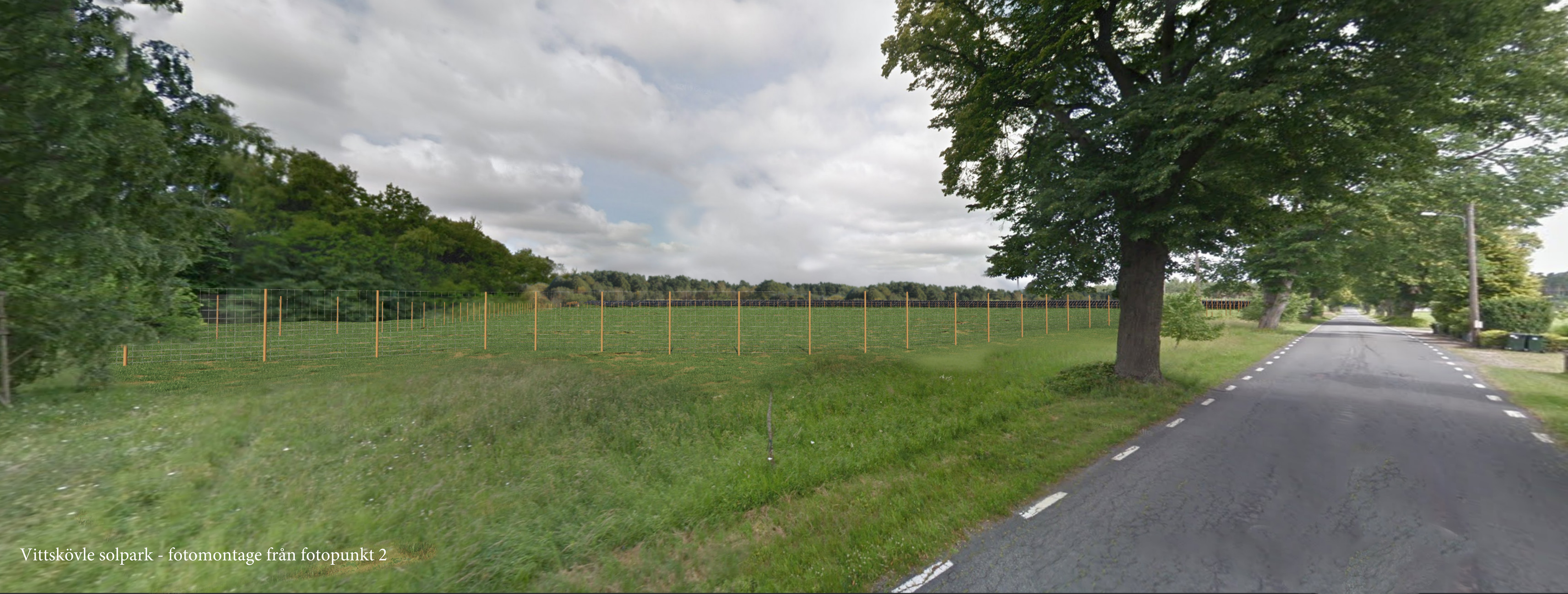
Vittskövle solpark - fotomontage från fotopunkt 2