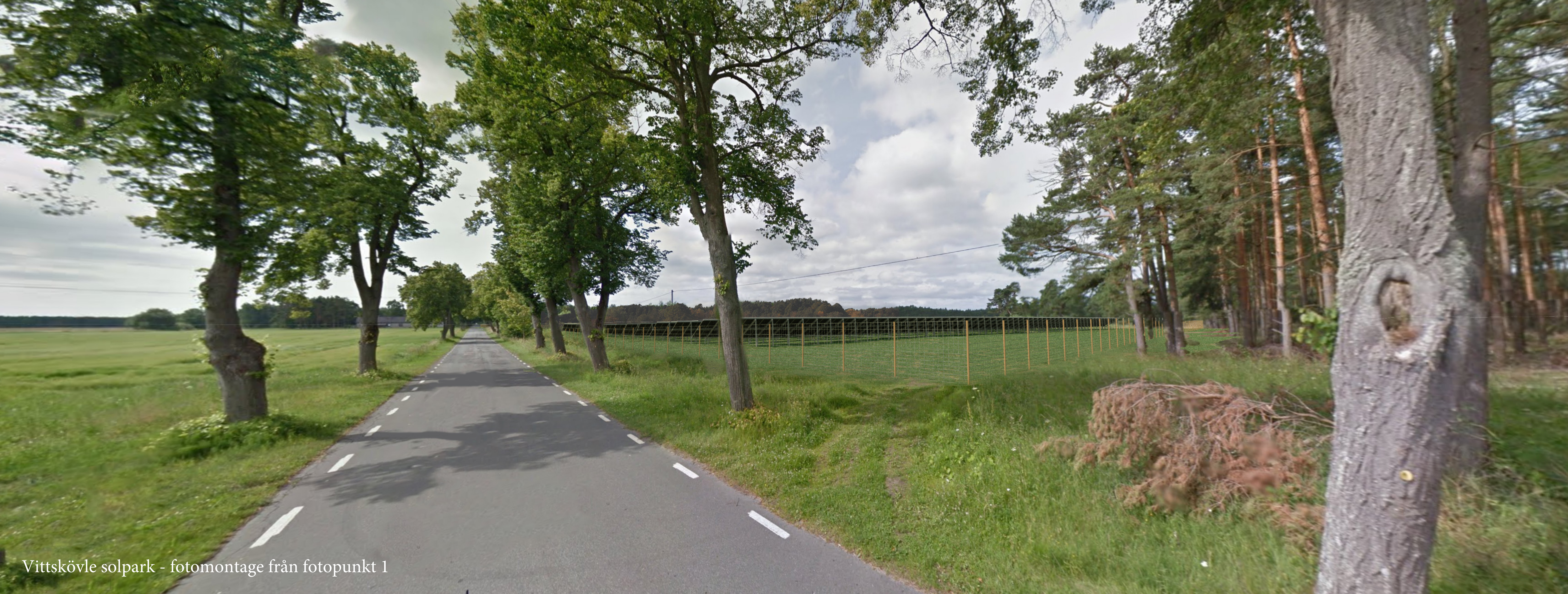
Vittskövle solpark - fotomontage från fotopunkt 1