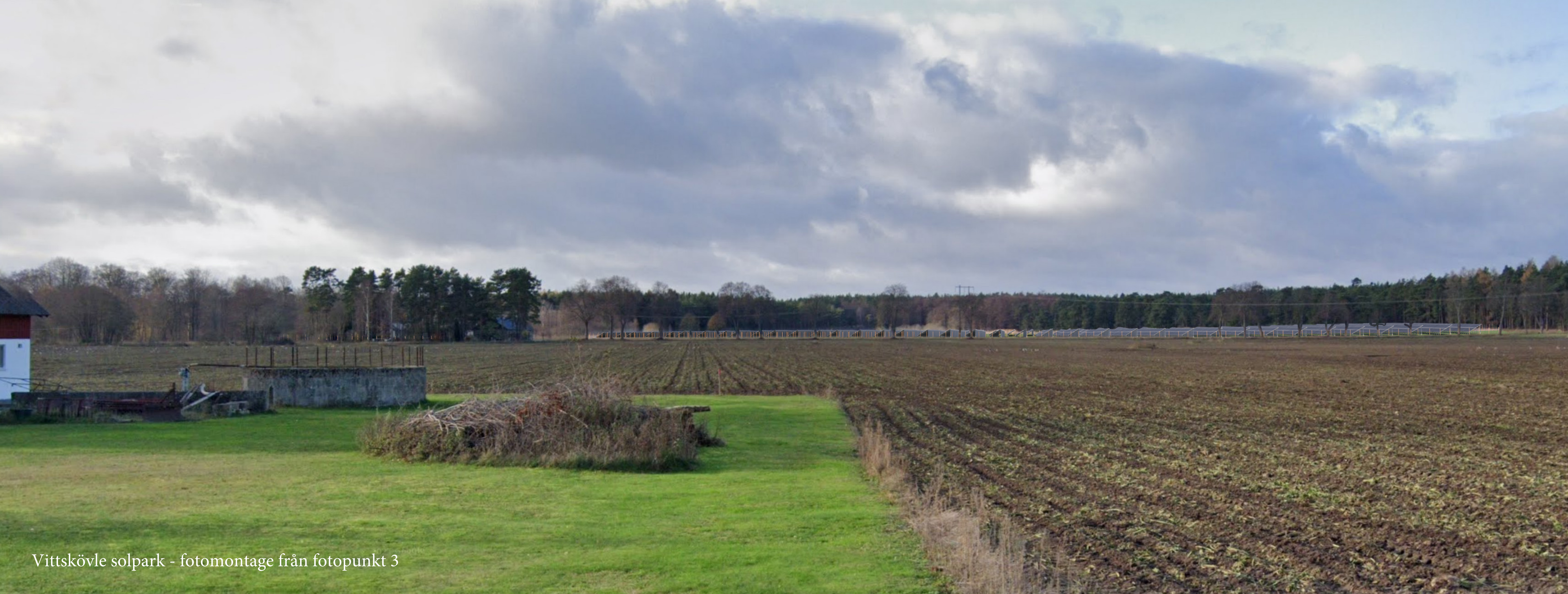
Vittskövle solpark - fotomontage från fotopunkt 3