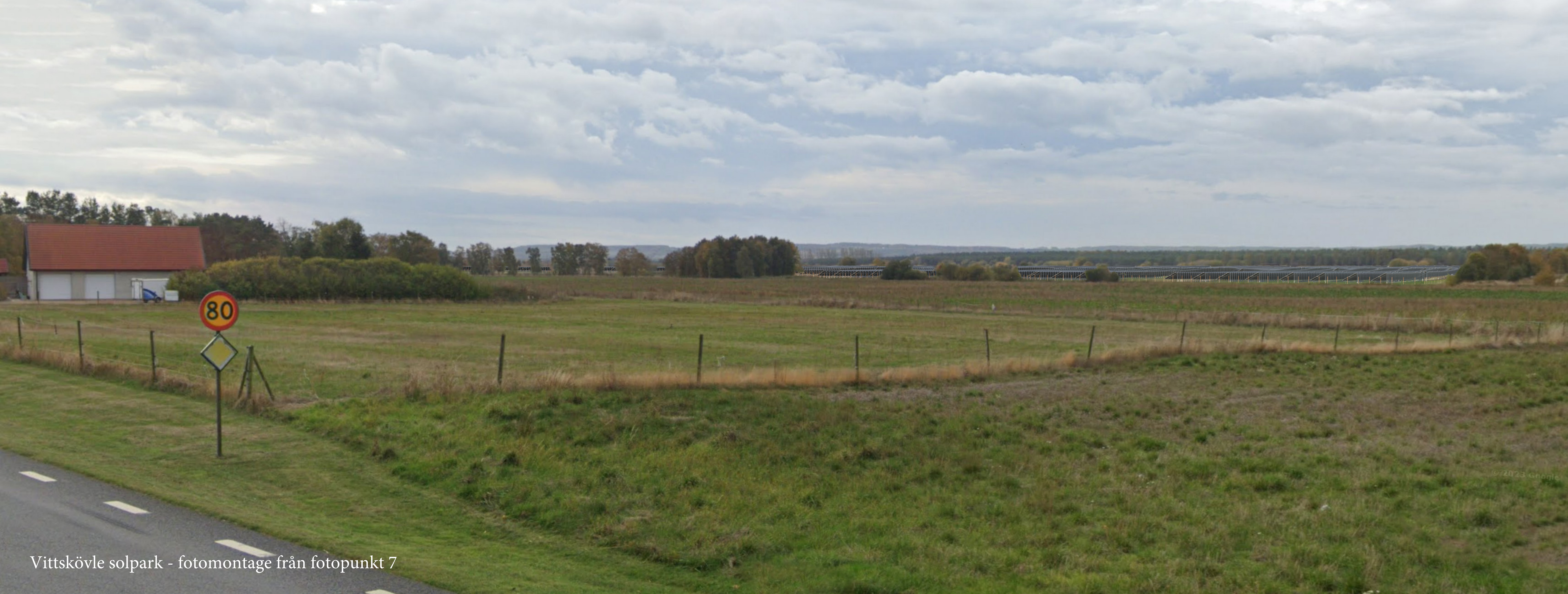
Vittskövle solpark - fotomontage från fotopunkt 7