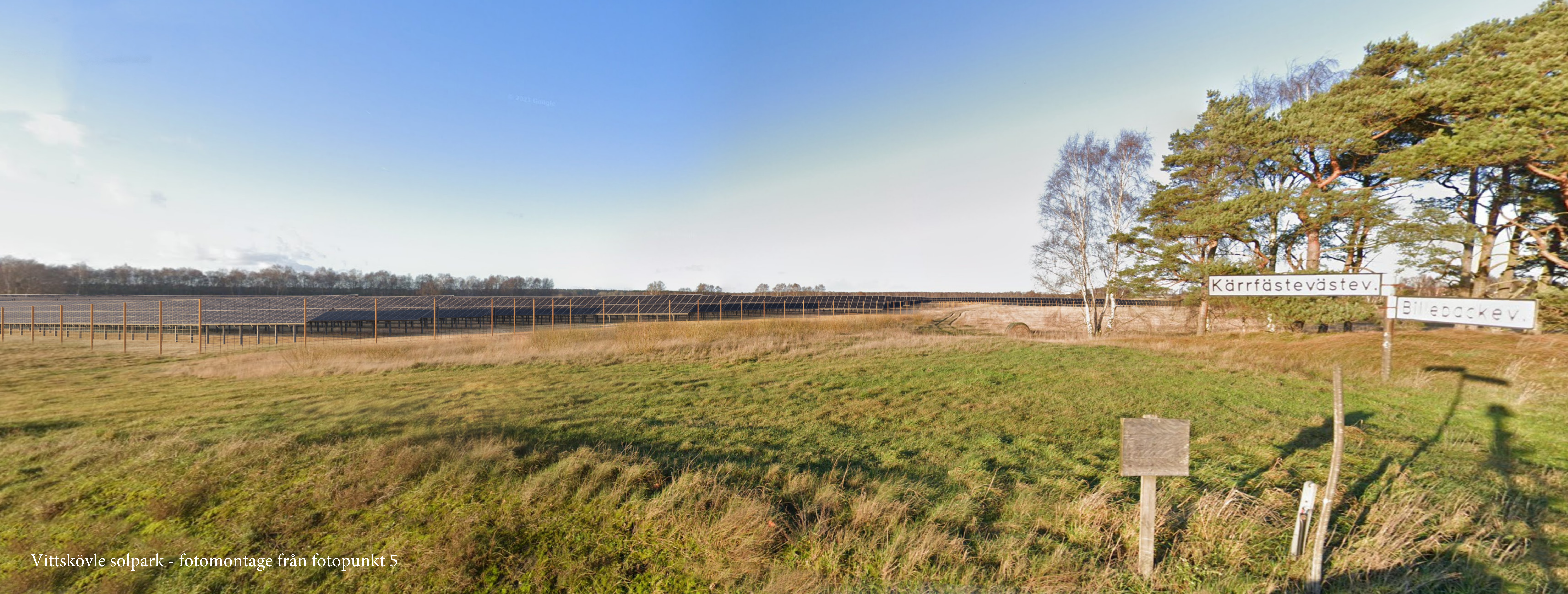
Vittskövle solpark - fotomontage från fotopunkt 5